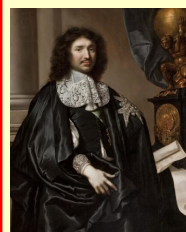
François-Michel Le Tellier marquis de Louvois

La collection de Louis XIV est née en 1668, avec la commande que Louvois, ministre de la Guerre, passa à Vauban du plan en relief de Dunkerque.