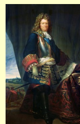
Sébastien Le Prestre marquis de Vauban